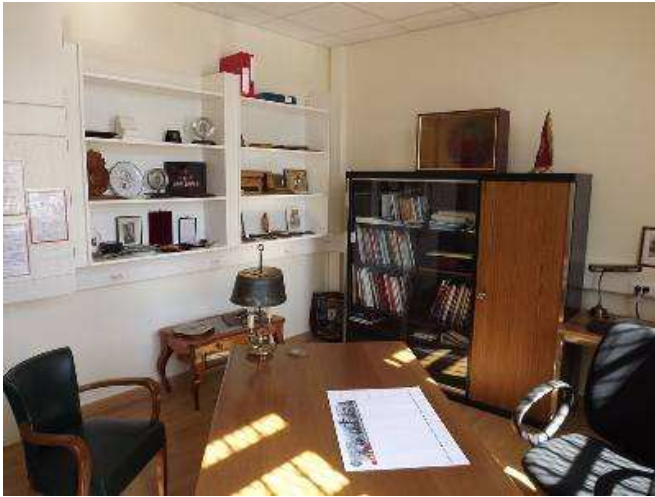
Bureau des Amicales

Après un accueil des participants au cercle du régiment, une messe était célébrée vers 9H45 par l'aumônier de la garnison d'Orléans dans la salle St Georges. Les invités se sont dirigés ensuite vers le bâtiment PC du 12 e R.C. pour visiter la "Maison des Cuirassiers" : un bureau pour les amicales et 4 salles (indépendantes de la salle d'honneur du régiment) qui permettront d'exposer des souvenirs des 11 régiments dissous.