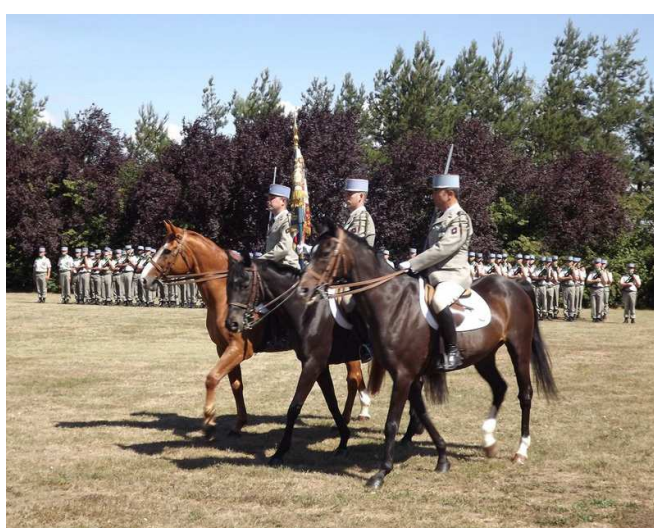
La Garde à l'étendard

Les photos ci-dessus relatives à la prise d'armes d'Olivet ont été prises par le Lieutenant Bureau de l'UNABCC L'amicale le remercie bien vivement.