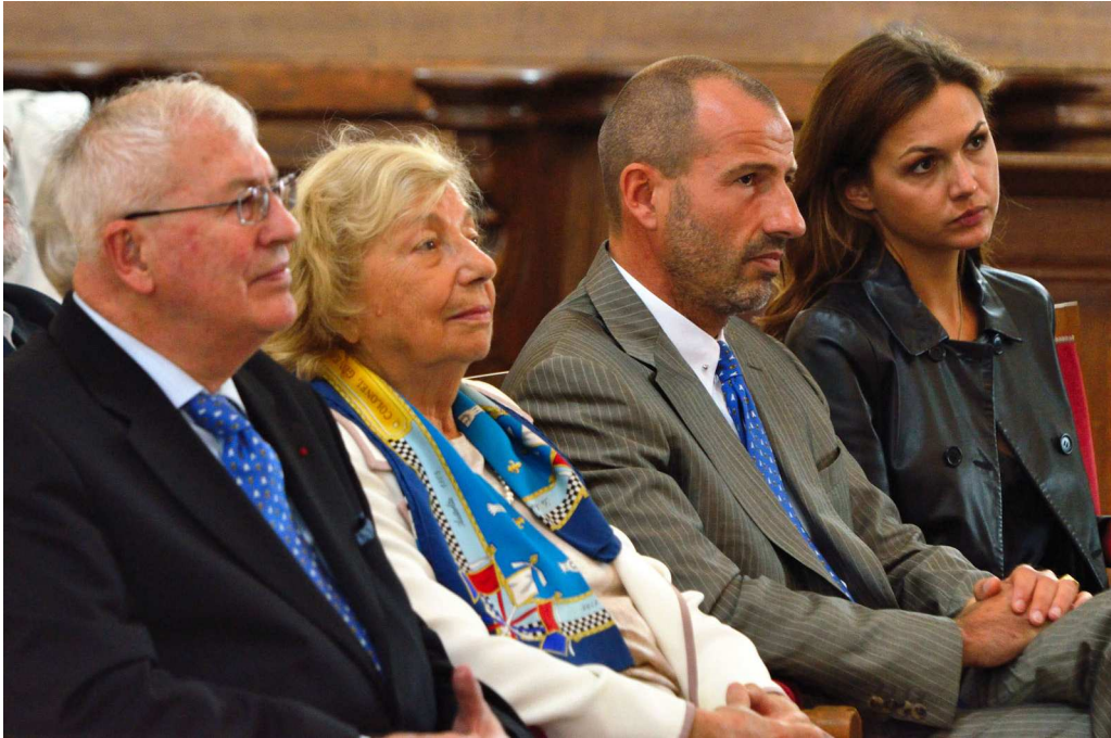
Le famille de La Tour d'Auvergne lors de la messe en Saint-Louis des Invalides