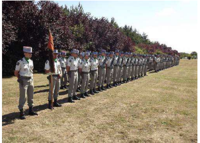
Le 12 e Rrégiment de Cuirassiers rassemblé

La prise d'armes a débuté à 11H00 ; le chef de corps du 12 a honoré le 1 er Cuirassiers en ne faisant participer à la prise d'armes que l'étendard du Turenne-Cavalerie, sorti de Vincennes pour l'occasion. Après un hommage rendu au chasseur du RCP mort quelques jours auparavant en Afghanistan, il y a eu une remise de décoration à trois cadres puis l'adieu aux armes d'un capitaine du régiment.