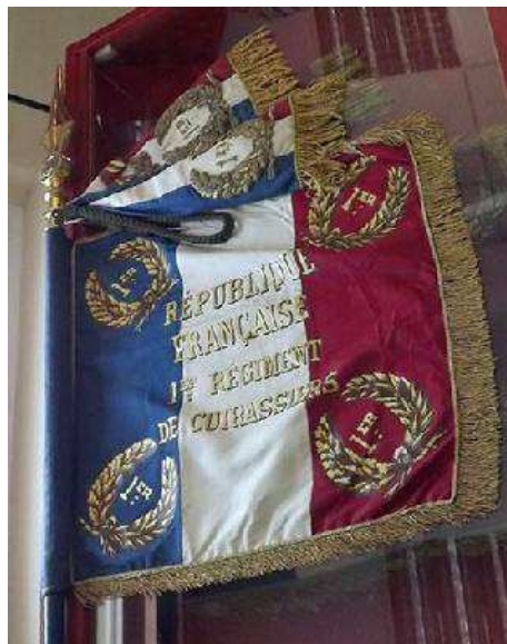
L'étendard du 1 er Régiment de Cuirassiers

La prise d'armes a débuté à 11H00 ; le chef de corps du 12 a honoré le 1 er Cuirassiers en ne faisant participer à la prise d'armes que l'étendard du Turenne-Cavalerie, sorti de Vincennes pour l'occasion. Après un hommage rendu au chasseur du RCP mort quelques jours auparavant en Afghanistan, il y a eu une remise de décoration à trois cadres puis l'adieu aux armes d'un capitaine du régiment.